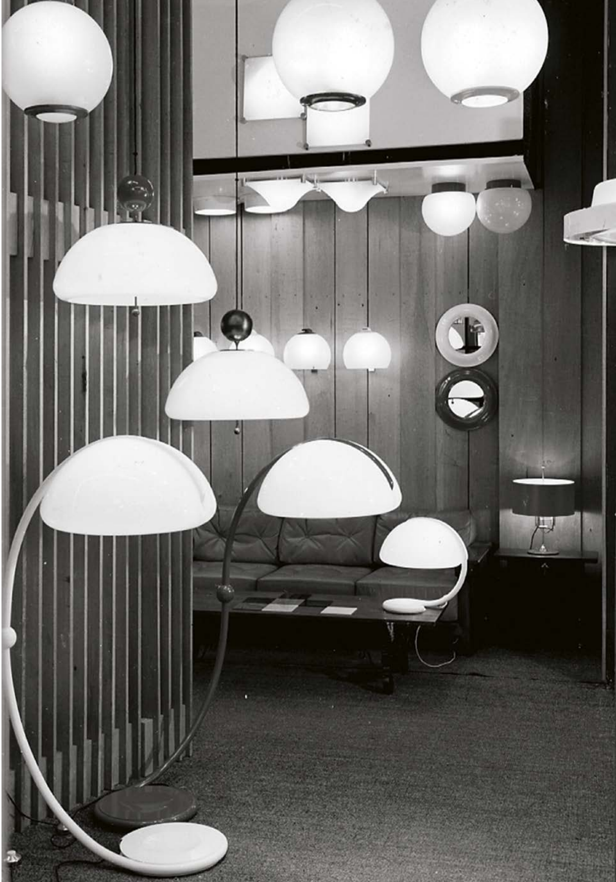
44ª FIERA DI MILANO 1966